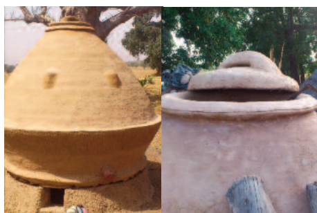
Figure 2 : Grenier traditionnel amélioré