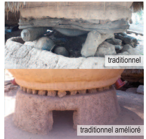
Figure 5 : Comparaison ancien et nouveau grenier