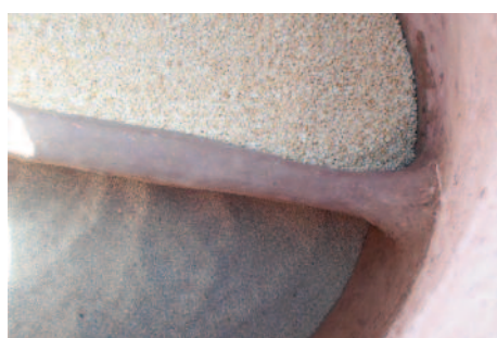
Figure 3 : Cloisonnement