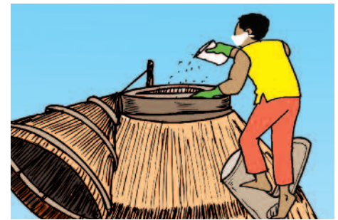
Figure 6 : Désinfection des grains