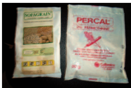
Figure 4 : Pesticides recommandés