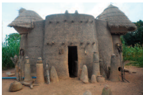
Figure 1 : Grenier amélioré tata

Après l'égrenage, vannage et triage et séchage, les grains de maïs peuvent être stockés dans les sacs ou silo métallique pour des conservations de longue durée ou stocké dans des greniers en terre améliorés. Ce type de grenier se rencontre beaucoup plus au nord du Bénin où il sert non seulement à conserver le maïs grains mais aussi le sorgho. Le socle sert de poulailler pour la volaille domestique. La présente fiche décrit les bonnes pratiques de stockage et conservation de maïs en grains dans ce type de grenier.